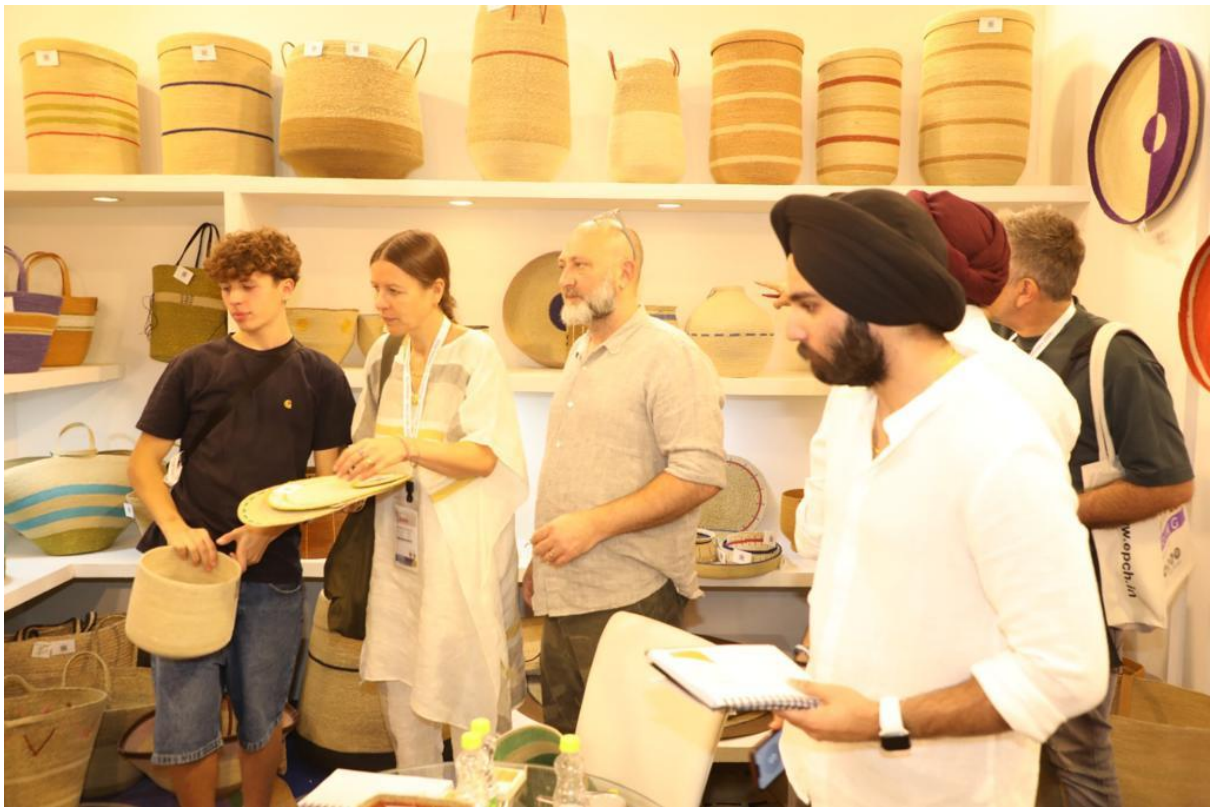
Photo 4&5: Overwhelming Response of Overseas Buyers during Opening Day of 56th Edition of IHGF-DELHI FAIR – Autumn'23 and Delhi Fair Furniture 2023 in India Expo Mart, Greater Noida